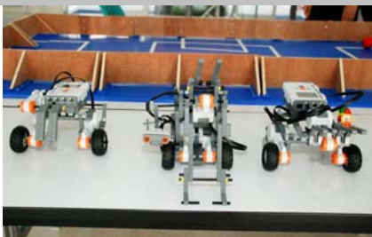
จากซ้าย รองชนะเลิศลำดับที่ 2 รองชนะเลิศลำดับที่ 1 และ ชนะเลิศ