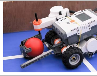
ทีม Idea Work