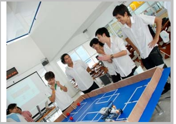
ทีม We are one

ทีมที่ได้รับรางวัลชนะเลิศได้แก่ ทีม We are one รางวัลรองชนะเลิศลำดับที่ 1 ได้แก่ ทีม No Name และรางวัลรองชนะเลิศลำดับที่ 2 ได้แก่ ทีม Idea Work