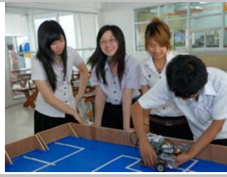
ทีม New Winner

ทีมที่ผ่านไปสู่การแข่งขันรอบที่ 2 ได้แก่ ทีม New Winner ทีม We are one ทีม Idea Work และ ทีม No Name โดยแต่ละทีมมีเวลาอีก 90 นาที ในการปรับแต่งหุ่นยนต์