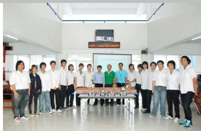
ผู้เข้าแข่งขันและคณะกรรมการ ถ่ายภาพร่วมกัน