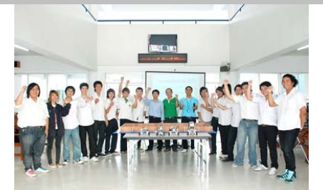
ผู้เข้าแข่งขันและคณะกรรมการ ถ่ายภาพร่วมกัน