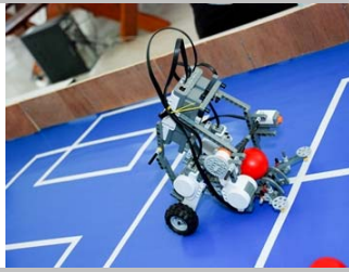
ทีม No Name